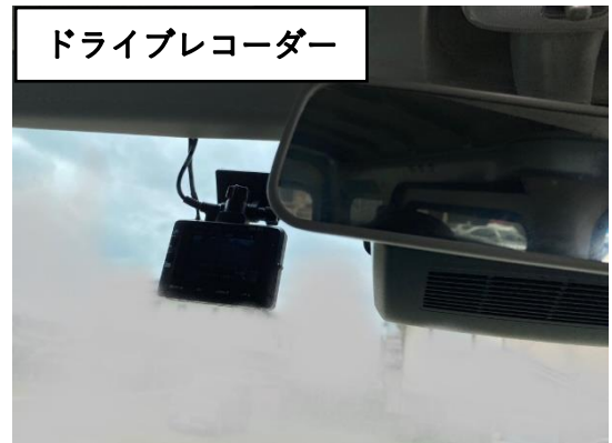
ドライブレコーダー