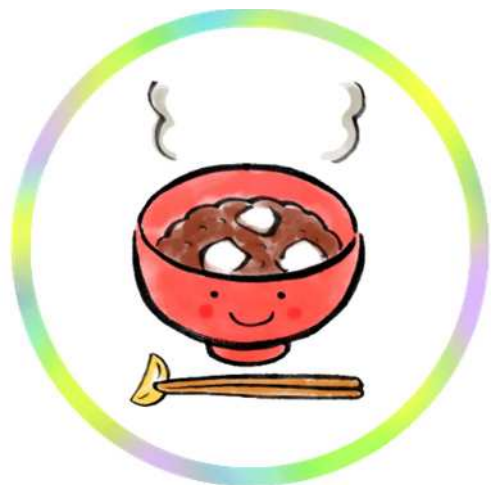
ほっと一息☆白玉ぜんざい(無料♪)