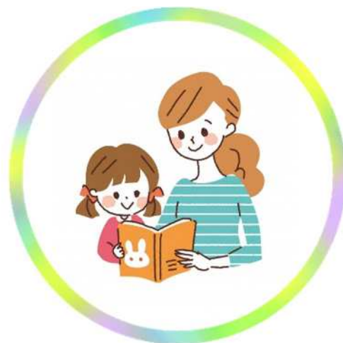
託児コーナー【要予約】6ヶ月以上