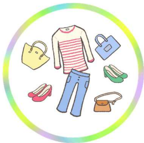
フリーマーケット(子供服や日用品など)(無料♪)